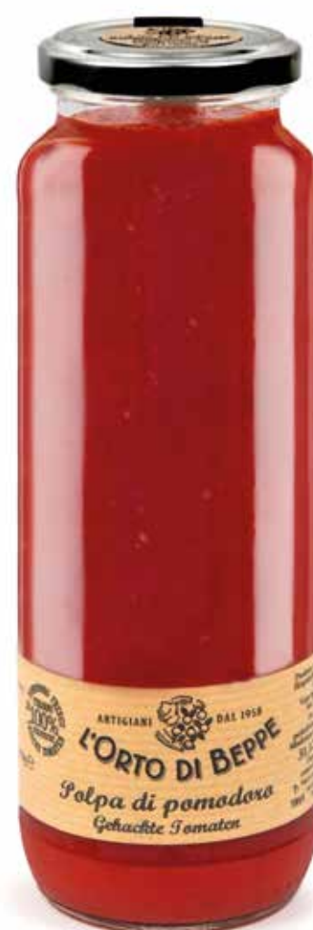
cod. 4000 POLPA DI POMODORO CHOPPED TOMATOES 650g / 22,92oz box: 6/12pz

DISPONIBILE ANCHE ALSO AVAILABLE 2300g / 81,13oz