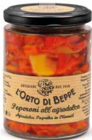
cod. 5618 PEPERONI IN AGRODOLCE PEPPERS BITTERSWEET 280g / 13.8oz box: 6/12pz

DISPONIBILE ANCHE ALSO AVAILABLE 500g / 17,63oz 3000g / 105,82oz