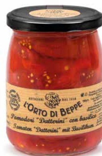
cod. 4581 DATTERINI SPACC.LI CON BASILICO HALF TOMATOES "DATTERINI" WITH BASIL 500g / 17,63oz box: 6/12pz

DISPONIBILE ANCHE ALSO AVAILABLE 2500g / 88,18oz