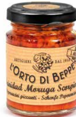
cod. 4642 PEPERONCINI PICCANTI "TRINIDAD MORUGA SCORPION" CHILLI PEPPERS "TRINIDAD MORUGA SCORPION" 90g / 3.17 oz box: 6/12pz