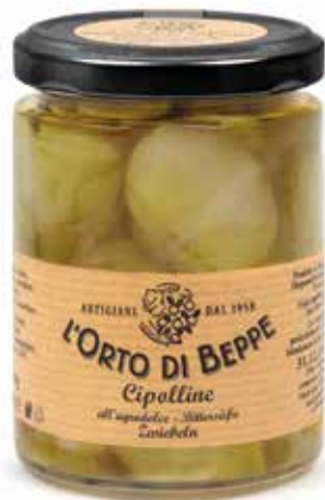
cod. 4307 CIPOLLINE "BORETTANE" IN AGRODOLCE SMALL ONIONS "BORETTANE" BITTERSWEET 280g / 13.8oz box: 6/12pz

DISPONIBILE ANCHE ALSO AVAILABLE 500g / 17,63oz