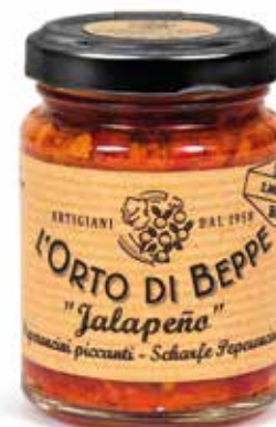
cod. 5113 PEPERONCINI PICCANTI "JALAPEÑO" CHILLI PEPPERS "JALAPEÑO" 90g / 3.17 oz box: 6/12pz