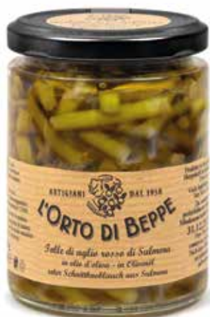
cod. 5151 TOLLE DI AGLIO ROSSO DI SULMONA GERMOGLI DI AGLIO RED SLICED GARLIC "di Sulmona" GARLIC SPROUTS 280g / 9.9oz box: 6 / 12pz