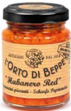
cod. 5069 PEPERONCINI PICCANTI "HABANERO RED" CHILLI PEPPERS "HABANERO RED" 90g / 3.17 oz box: 6/12pz