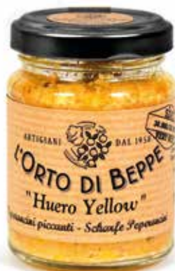
cod. 4970 PEPERONCINI PICCANTI "HUERO YELLOW" CHILLI PEPPERS "HUERO YELLOW" 90g / 3.17 oz box: 6/12pz