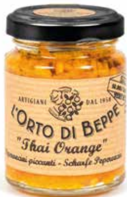
cod. 4994 PEPERONCINI PICCANTI "THAI ORANGE" CHILLI PEPPERS "THAI ORANGE" 90g / 3.17 oz box: 6/12pz