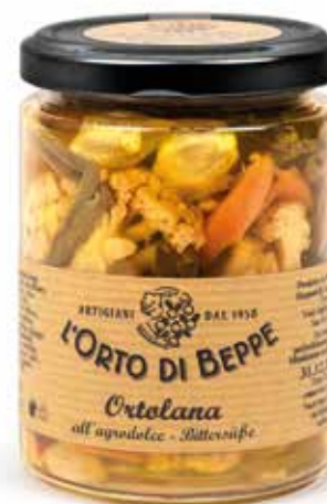
cod. 3720 ORTOLANA IN AGRODOLCE CAVOLFIORI, CAROTE, PEPERONI, SEDANO, CIPOLLINE, FAGIOLINI "ORTOLANA" BITTERSWEET STRING BEANS, CAULIFLOWER, CARROT, PEPPERS, SMALL ONIONS 280g / 13.8oz box: 6/12pz

DISPONIBILE ANCHE ALSO AVAILABLE 500g / 17,63oz