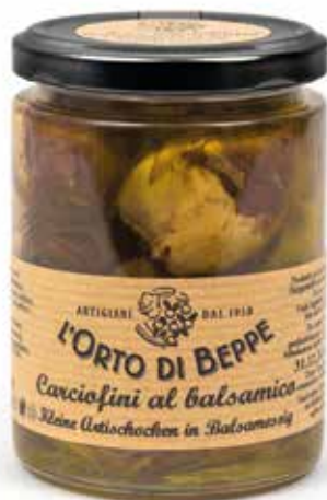
cod. 1405 CARCIOFINI ALL' ACETO BALSAMICO DI MODENA IGP SMALL ARTICHOSES WITH BALSAMIC VINEGAR OF MODENA IGP 280g / 13.8oz box: 6/12pz

ORTAGGI AL BALSAMICO/IN AGRODOLCE · VEGETABLES WHIT BALSAMIC VINEGAR/"BITTERSWEET"