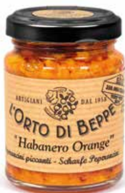
cod. 4659 PEPERONCINI PICCANTI "HABANERO ORANGE" CHILLI PEPPERS "HABANERO ORANGE" 90g / 3.17 oz box: 6/12pz