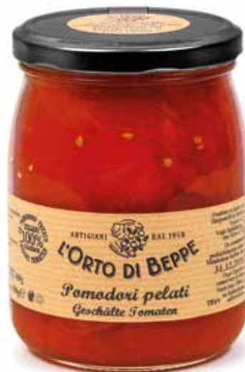
cod. 4536 POMODORI PELATI PEELED TOMATOES 500g / 17,63oz box: 6/12pz

DISPONIBILE ANCHE ALSO AVAILABLE 2500g / 88,18oz