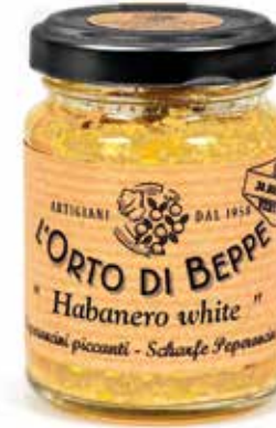
cod. 4987 PEPERONCINI PICCANTI "HABANERO WHITE" CHILLI PEPPERS "HABANERO WHITE" 90g / 3.17 oz box: 6/12pz