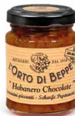
cod. 5076 PEPERONCINI PICCANTI "HABANERO CHOCOLATE" CHILLI PEPPERS "HABANERO CHOCOLATE" 90g / 3.17 oz box: 6/12pz