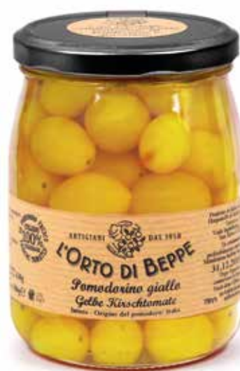
cod. 5823 POMODORINO GIALLO YELLOW SMALL TOMATOES 500g / 17,63oz box: 6/12pz