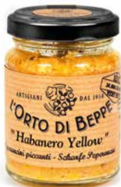
cod. 4970 PEPERONCINI PICCANTI "HABANERO YELLOW" CHILLI PEPPERS "HABANERO YELLOW" 90g / 3.17 oz box: 6/12pz