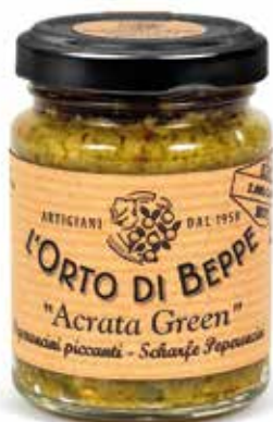
cod. 5090 PEPERONCINI PICCANTI "ACRATA GREEN" CHILLI PEPPERS "ACRATA GREEN" 90g / 3.17 oz box: 6/12pz