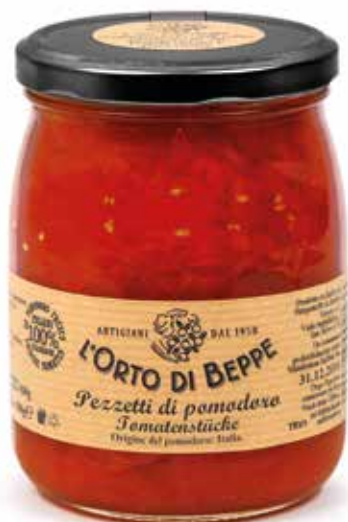
cod. 5380 PEZZETTI DI POMODORO SLICED PEELED TOMATOES 500g / 17,63oz box: 6/12pz