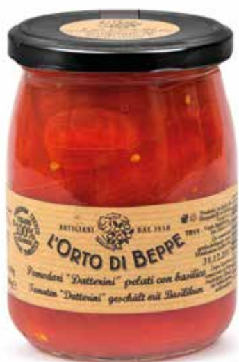
cod. 4598 DATTERINI PELATI CON BASILICO PEELED TOMATOES "DATTERINI" WITH BASIL 500g / 17,63oz box: 6/12pz