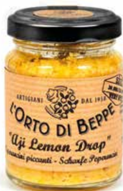
cod. 5007 PEPERONCINI PICCANTI "AJI LEMON DROP" CHILLI PEPPERS "AJI LEMON DROP" 90g / 3.17 oz box: 6/12pz