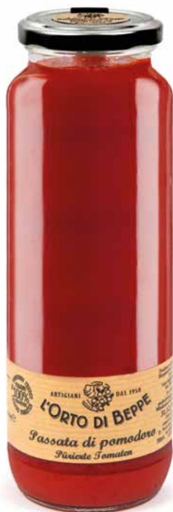
cod. 2310 PASSATA DI POMODORO BASILICO TOMATO SAUCE WITH BASIL 670g / 23,63 oz box: 6/12pz

Il re dell'orto e della cucina • The king of the garden and the kitchen