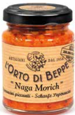
cod. 5083 PEPERONCINI PICCANTI "NAGA MORICH" CHILLI PEPPERS "NAGA MORICH" 90g / 3.17 oz box: 6/12pz