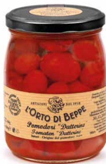
cod. 5816 POMODORI "DATTERINO" "DATTERINO" SMALL TOMATOES 500g / 17,63oz box: 6/12pz